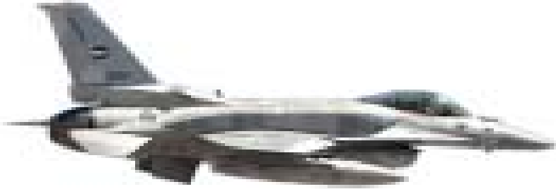
கிபீர் போர் விமானம்

ப தேசிய பாதுகாப்புடன் தொடர்புடைய விடயம் என்பதால் இவ்வாறான விடயங்கள் தொடர்பாக கேள்வி எழுப்ப உங்களால் முடியாது.