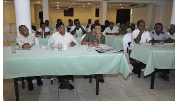
நிகழ்வில் பங்குபற்றிய ஊடகவியலாளர்கள்