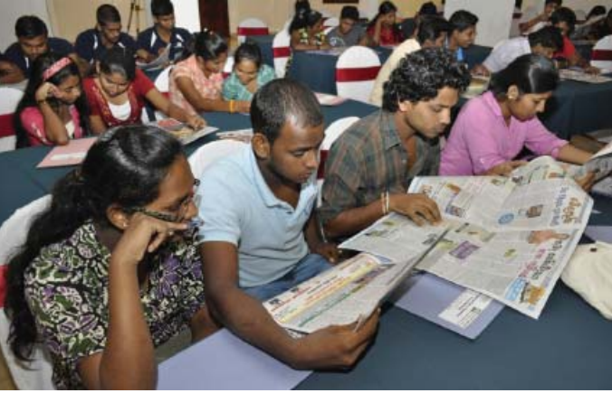
ஊடக பயிற்சி செயலமர்வில் பங்குபற்றிய இளைஞர்கள்